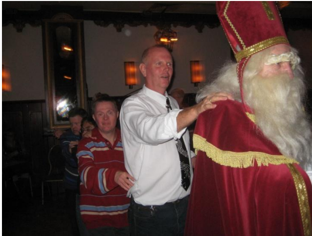
Sinterklaas in de polonaise!!!

Vrijdag 25 november kwam Sinterklaas met zijn pieten bij de SASV op bezoek. Het werd weer een groot feest. Smartlappenkoor de Klankentappers was ook weer van de partij en zorgde dat de sfeer er goed in zat. Sinterklaas liep zelfs mee in de polonaise...en dat op zijn oude dag!! Een mooie avond waar we met veel plezier aan terug denken. Ook de cadeautjes vielen in de smaak.